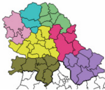
4. ábra: Aktuális körzetesítés Vajdaságban

A körzeteket 8 a Szerb állam Belgrádból irányítja és ezeket a központi hatalom, még nem ruházta át a tartományra. A jelenlegi közigazgatási beosztás szerint Vajdaság területe 7 körzetre és 44 községre oszlik. A magyarságot az Újvidék, Nagyikinda és Szabadka székhelyű körzetek között osztották szét úgy, hogy a vidék magyarjainak 48,9%-a maradt a természetes vonzásközpont, Szabadka alárendeltségében, 40% pedig Nagyikinda, illetve 11,1% Újvidék körzetéhez került. Ez az, amin a magyar politikai vezetés feltétlenül változtatni szeretne.