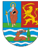
3. ábra: Vajdaság aktuális címere

nya, a Szerb Köztársaság kötelékében, amely területének sajátos nemzeti, történelmi, kulturális és egyéb sajátosságai alapján jött létre, mint többnemzetiségű, multikulturális és többvallású demokratikus európai régió. Vajdaság Közép Európa egységes kulturális, civilizációs, gazdasági és földrajzi térségének szerves részét képezi” (1. szakasz) és jogi személyiséggel rendelkezik. „Vajdaság AT-ban 7 a szerbek, magyarok, szlovákok, horvátok, montenegróiak, románok, romák, bunyevácok, ruszinok és macedónok, valamint a tartományban élő többi számbelileg kisebb nemzeti közösségek jogaik érvényesítésében egyenrangúak.” (6. szakasz) A dokumentum szerint, a többnyelvűség, a multikulturalizmus és a többvallásosság kiemelt jelentőségű általános érték.