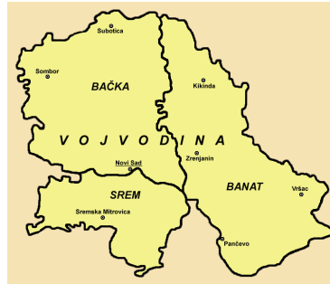
1. ábra: Vajdaság / Vojvodina földrajzi egységei