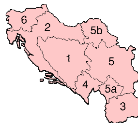
2. ábra: Vajdaság a Titói Jugoszláv föderáció konstitutív része

Vajdaság/Vojvodina 3 a Magyarországon élő szerbek önrendelkezési igényeként jelent meg a negyvennyolcas szabadságharc idején (Boarov 2001: 61). Az abszolutizmus alatt Bécsből irányítják a Szerb Vajdaságot (székhelye Temesvár) és a felszámolásáig (1860), valós önkormányzattal nem rendelkezett. Az Osztrák-Magyar Monarchia széthullását követően 1918. nov. elején szerb csapatok szállták meg és november 25-én az újvidéki szerb népgyűlés kimondta a Vajdaság elszakadását Magyarországtól. Alkotmányjogi szempontból ez a tartomány csak a második világháború után (1945) kap autonómiát. Ennek a területi autonómiának az igazi kiszélesedését Tito idejében nyerte (1974-1990-ig). Ebben az időszakban Vajdaság, a Jugoszláv Szövetségi Köztársaságban, a föderáció konstitutív részeként jelenik meg (a Szövetségi államot hat köztársaság és két autonóm tartomány alkotta).